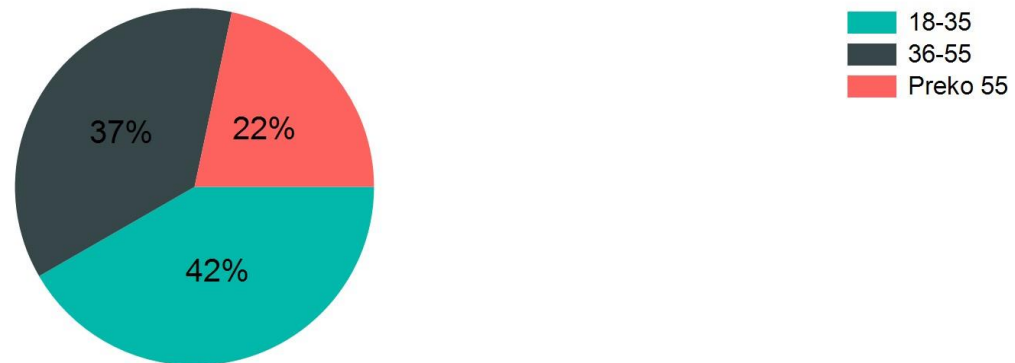
Procentualna struktura ispitanika/ca po starosti